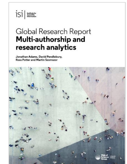
Read Multi-Authorship Report