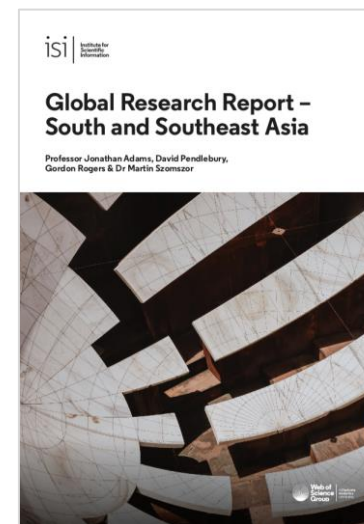
Read Southeast Asia Report