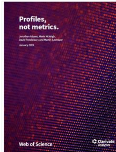
Read Profiles, not Metrics