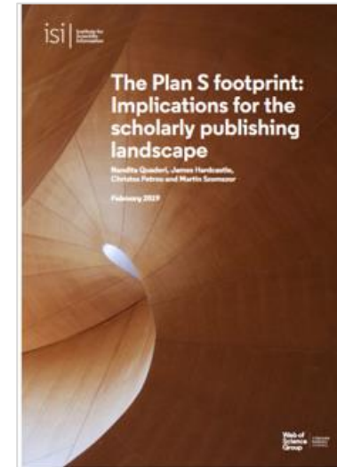
Read Plan S Footprint