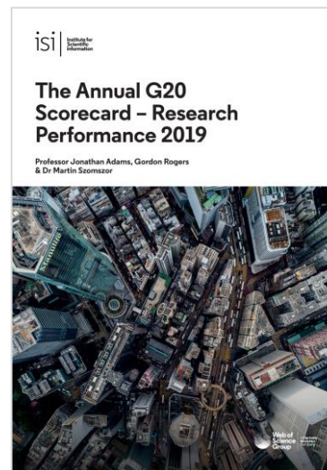
Read 2019 G20 Scorecard Report

Aflați mai multe despre tendințele din ecosistemul academic și fiți la curent cu cele mai bune practici de evaluare a cercetării.